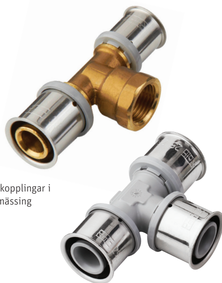
Presskopplingar i DZR mässing